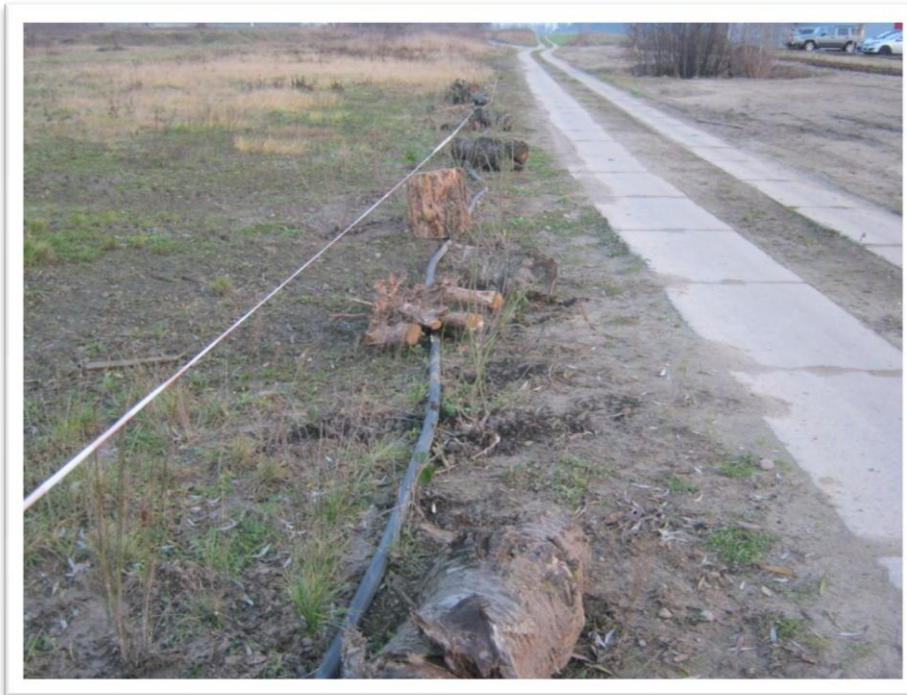
Abgrenzung zum Weg mit Stubben und Gehölzen