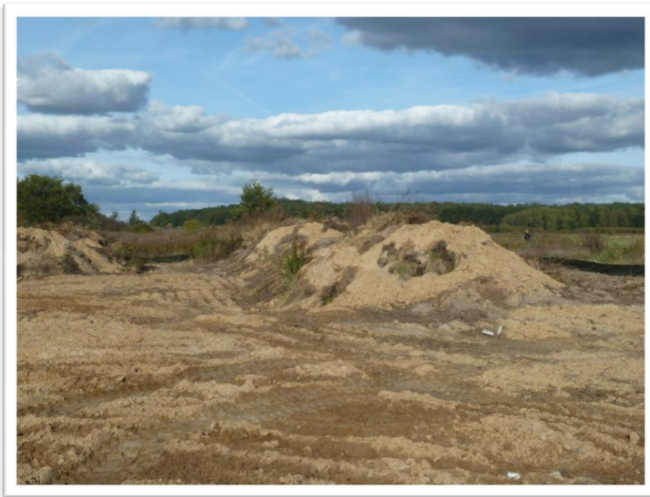
Wälle aus abgeplagtem Material