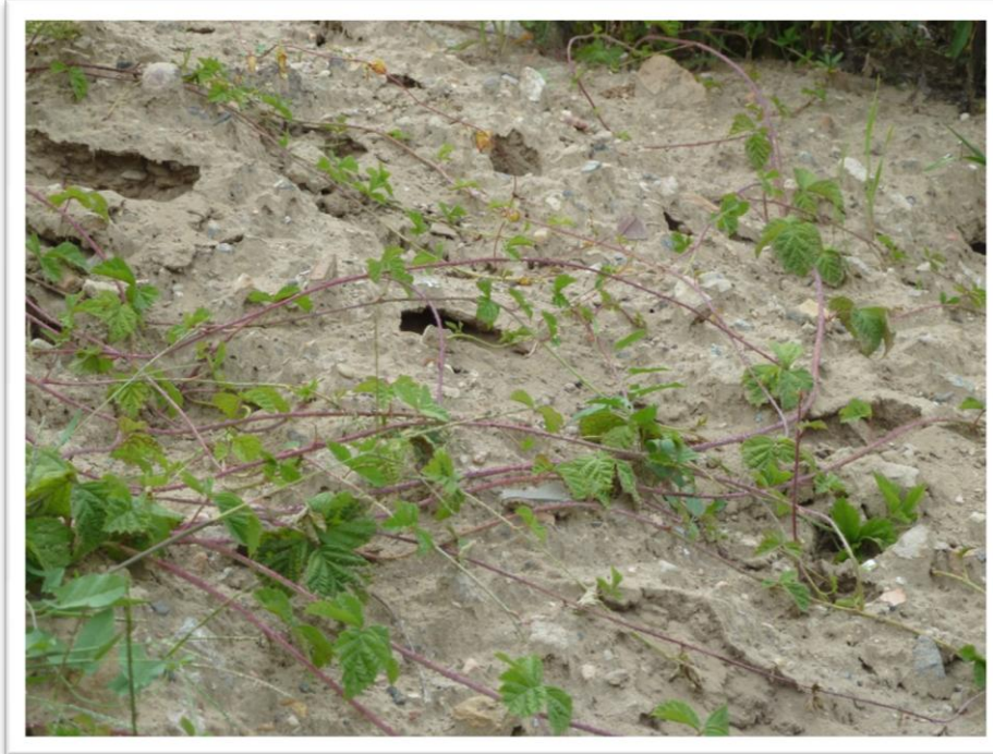
Eidechsenhöhlen in den Wällen