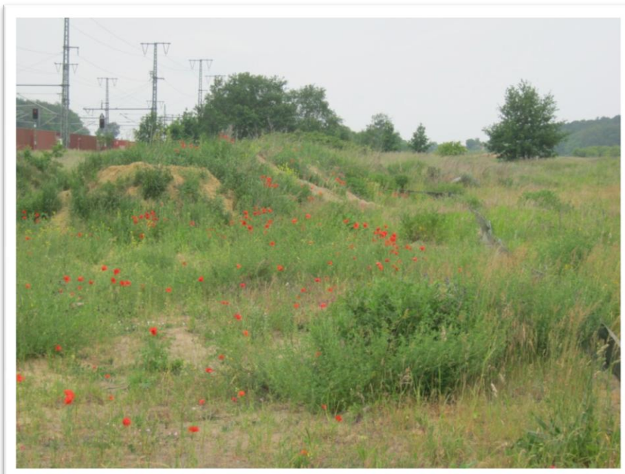
Maßnahmenfläche im Folgejahr