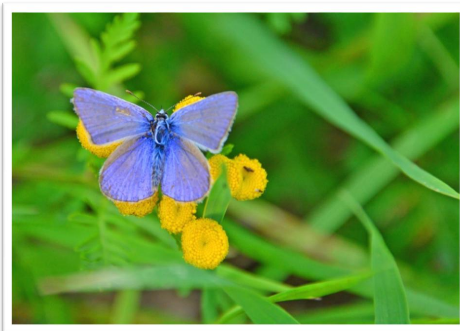
Hauhechelbläuling auf der Fläche