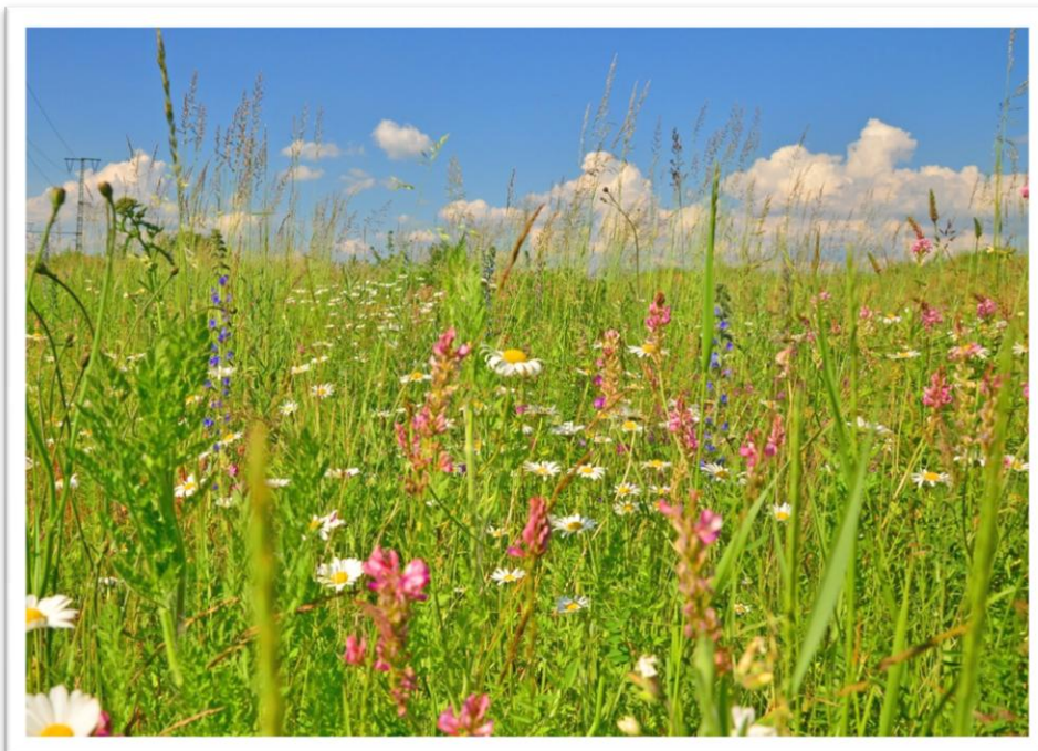
Sommeraspekt der Fläche